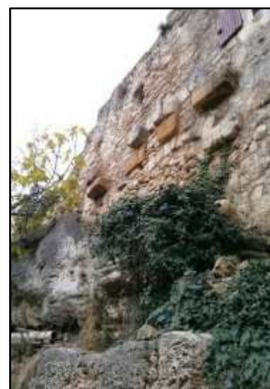
Rue du Barri, utilisation du rempart pour renfort de la presse des moulins à huile