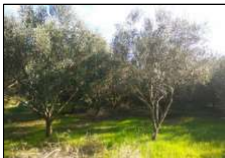
Rue des Velles, l'oliveraie Brauquier

A la veille de la Révolution, 60 000 oliviers occupaient à Saint Mitre plus de la moitié des terres cultivables.