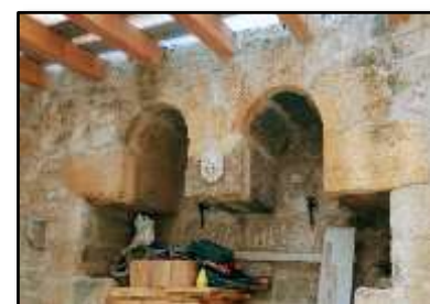
Emplacement d'un pressoir « à chapelle » (intérieur du rempart Ouest)