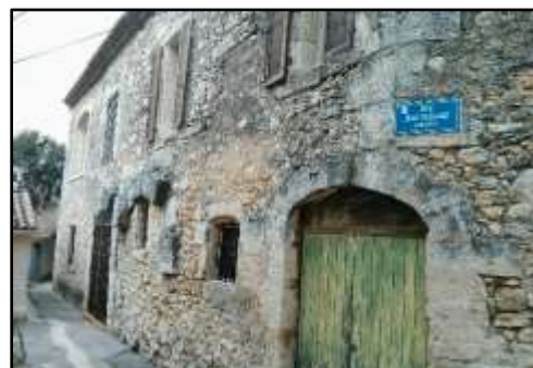
Rue Jean Ballard, le moulin « Barnès »

On produisait alors 2 000 hectolitres par an d'une huile renommée.