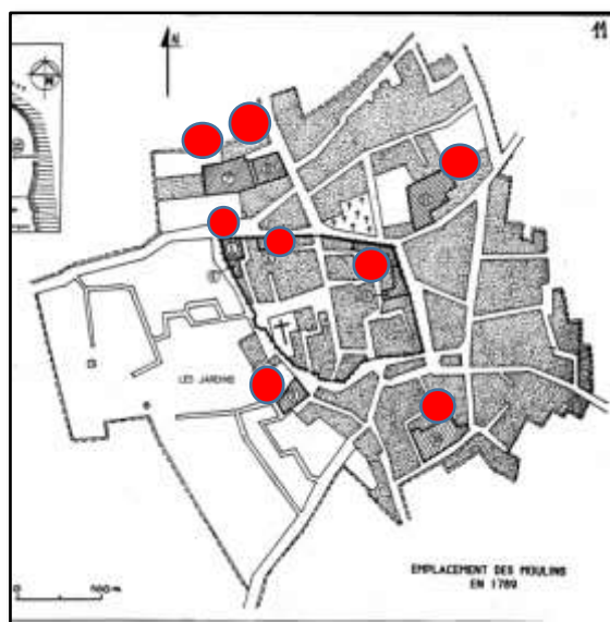
G.Fabre, M. Sabatier, M. Payani. L'olivier et les moulins à huile à la fin du XVIIIème siècle

Les pressoirs pouvaient bénéficier de la solidité des remparts.