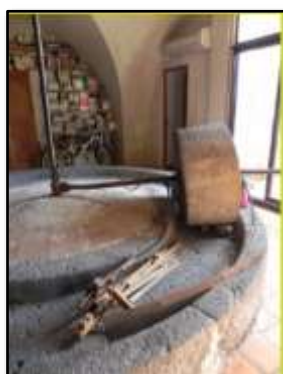
Moulin à « meule à sang » à force humaine ou animale, impasse Bonfilhon