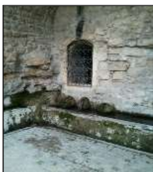
Fontaine des 3 canons

La provenance de l'eau est lointaine, peut-être la Fontaine de Vaucluse, et suppose l'existence de siphons.